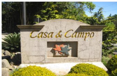
IDENTIFICACION DE LA LOTIFICACION