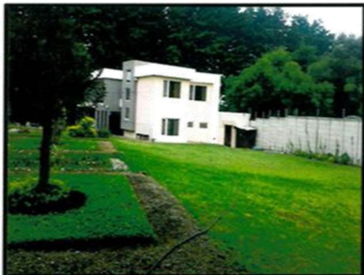
Jardín al frente