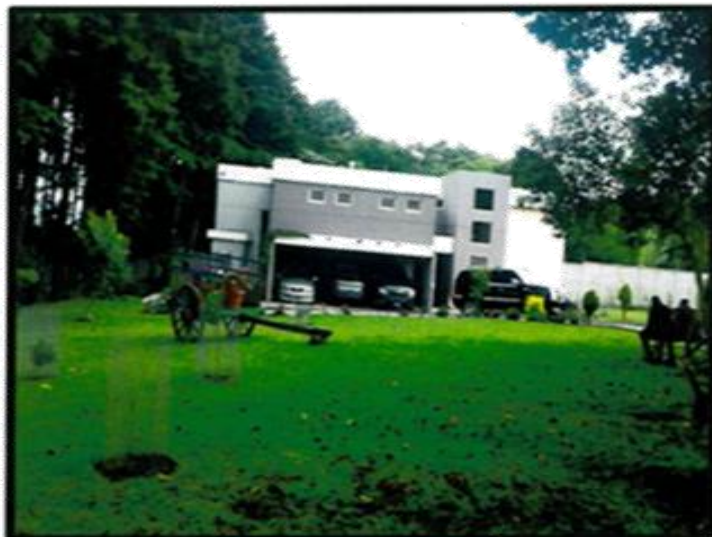
Jardín al frente