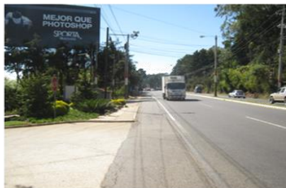
ACCESO DESDE LA CARRETERA