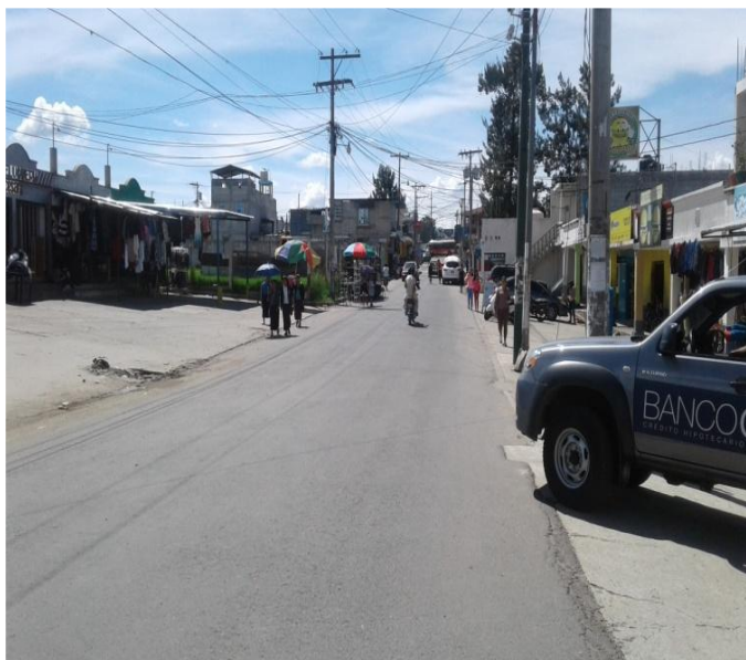
CALLE PRINCIPAL DE ACCESO AL SECTOR