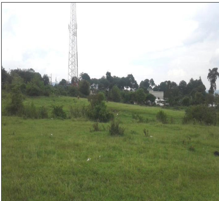
VISTA GENERAL DEL TERRENO