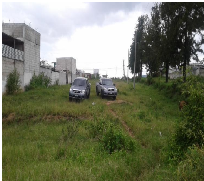
CALLE DE ACCESO AL TERRENO