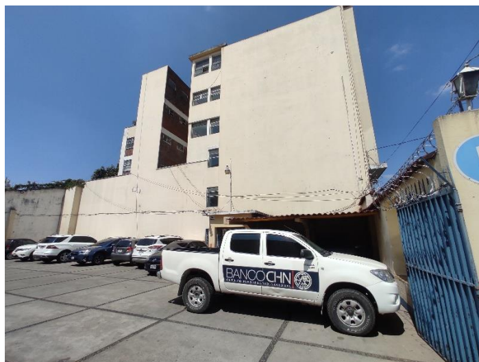
PARQUEO Y OFICINAS