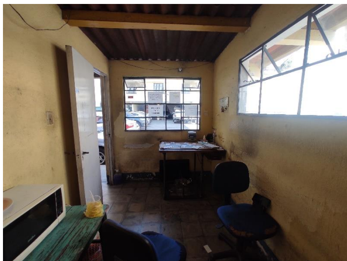
OFICINA Y BAÑOS