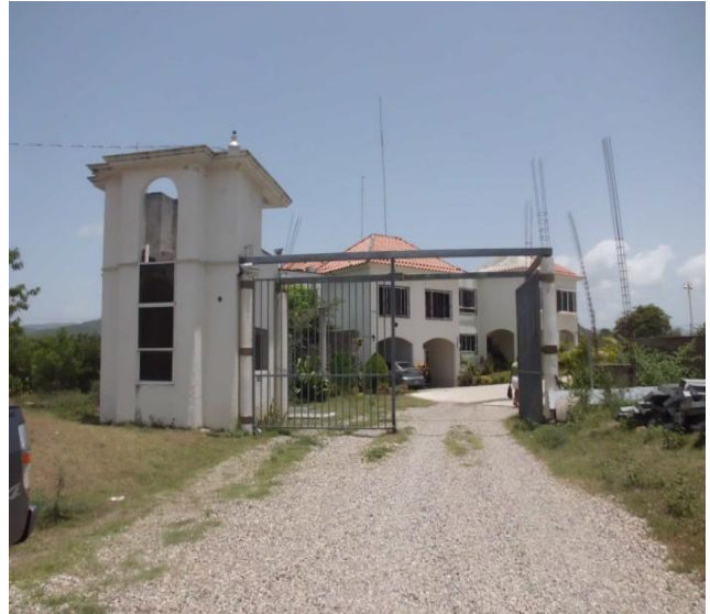
VISTA INGRESO AL RESIDENCIAL