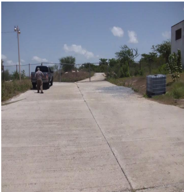
VISTA CALLE PRINCIPAL INTERNA DEL RESIDENCIAL