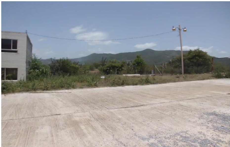
VISTA FRENTE AL TERRENO