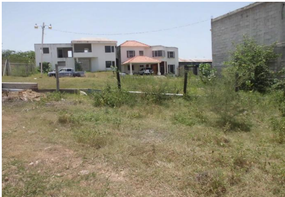
VISTA POSTERIOR AL TERRENO