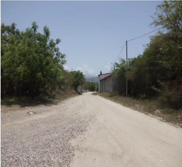
CAMINO DESDE LA CALLE PRINCIPAL