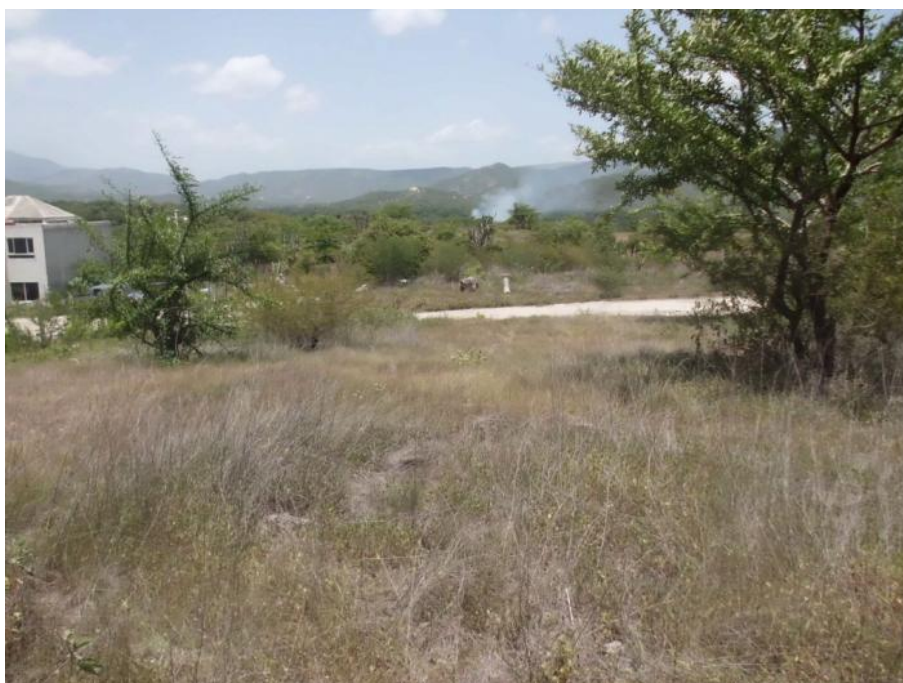
VISTA DEL INTERIOR DEL TERRENO