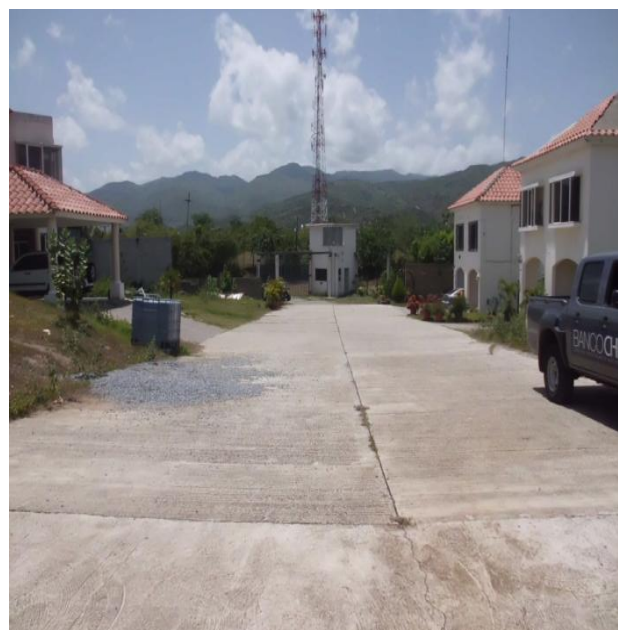
VISTA CALLE PRINCIPAL INTERNA DEL RESIDENCIAL