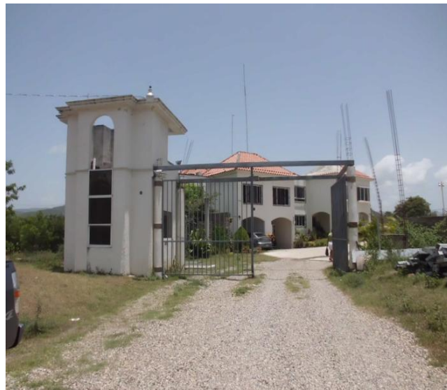
VISTA INGRESO AL RESIDENCIAL