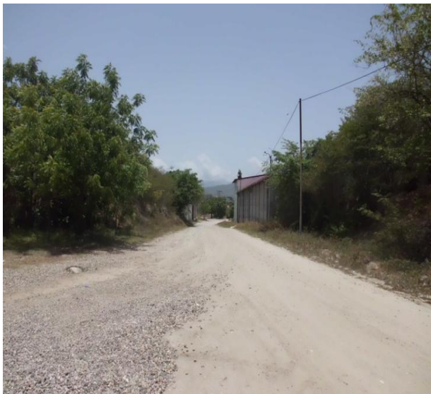
CAMINO DESDE LA CALLE PRINCIPAL