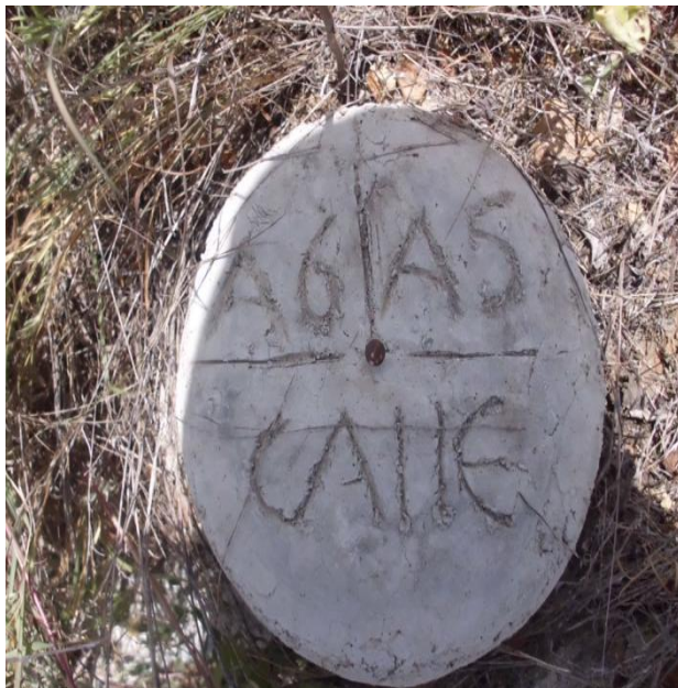
VISTA DE MOJÓN