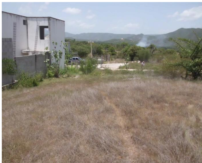
VISTA DEL INTERIOR DEL TERRENO