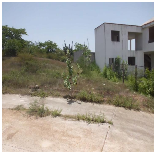
VISTA DEL TERRENO