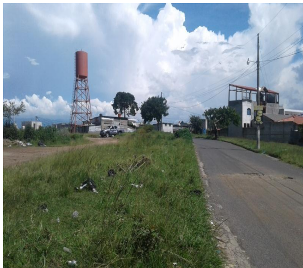
VISTA ACTUAL DEL ÁREA DONDE SE UBICAN LOS LOTES