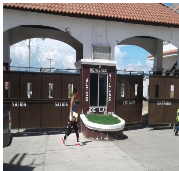
CALLE DE ACCESO PRINCIPAL DEL SECTOR