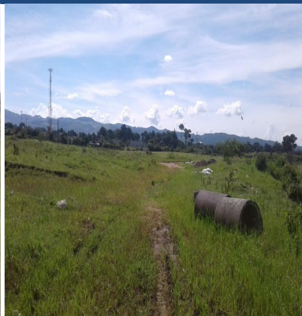
VISTA ACTUAL DEL ÁREA DONDE SE UBICAN LOS LOTES