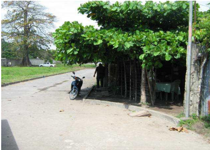
FRENTE AL INMUEBLE