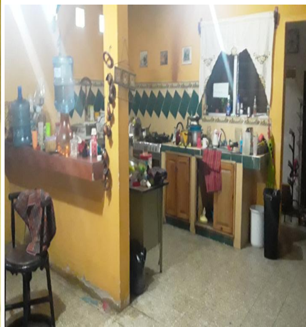
VISTA INTERNA DE LA CONSTRUCCIÓN