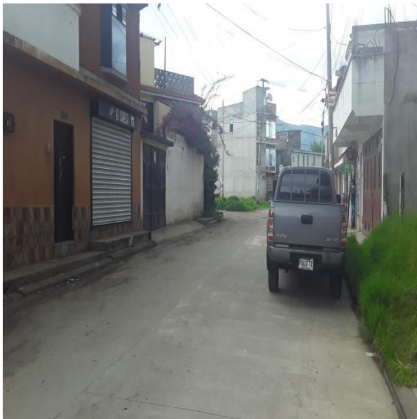
CALLE DE ACCESO AL INMUEBLE