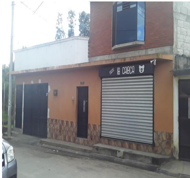
VISTA FRENTE AL INMUEBLE