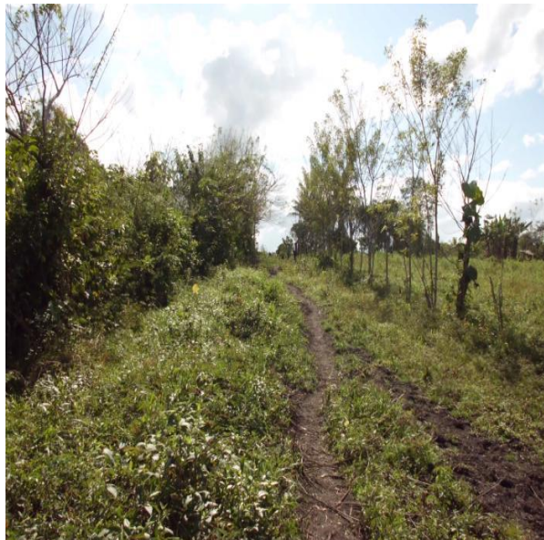
VISTA DE CALLE PRINCIPAL Y DEL SECTOR