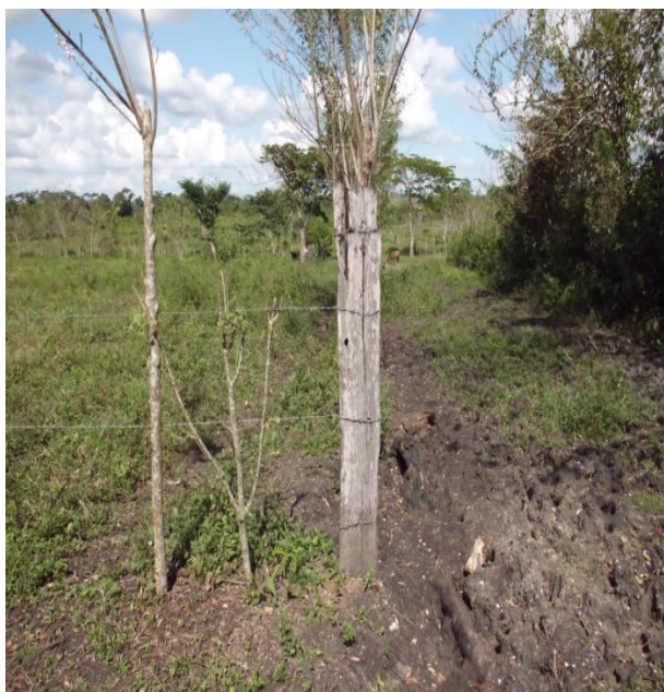
VISTA INTERNA DEL INMUEBLE