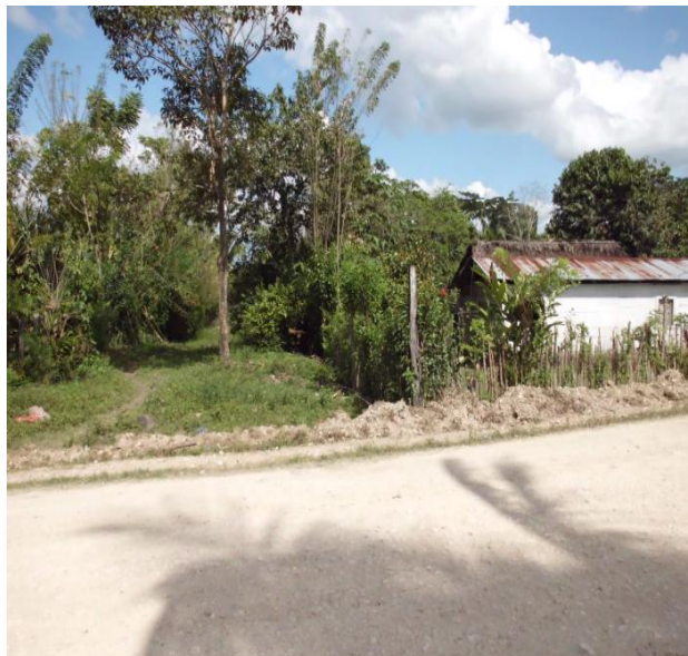
VISTA DE CALLE PRINCIPAL Y DEL SECTOR