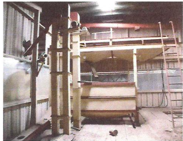
VISTA DE ELEVADORES Y SIFONES