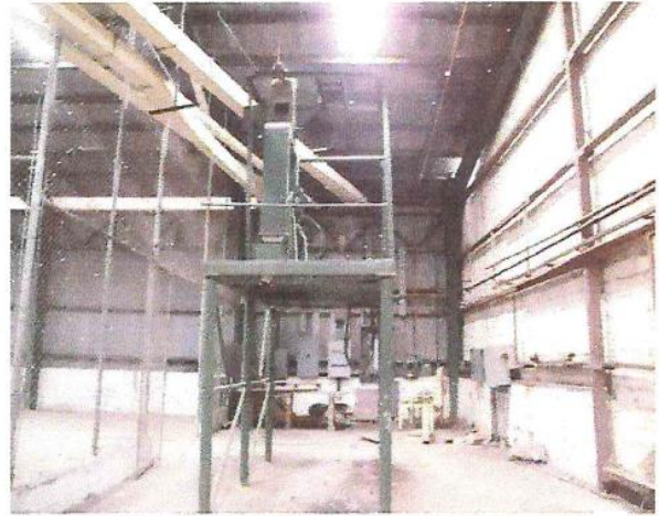
VISTA DE UNO DE LOS MOTORES