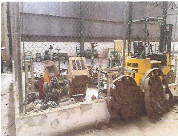
VISTA DE MOTORES DESMONTADOS