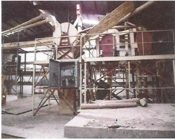
VISTA DE DESPULPADORAS